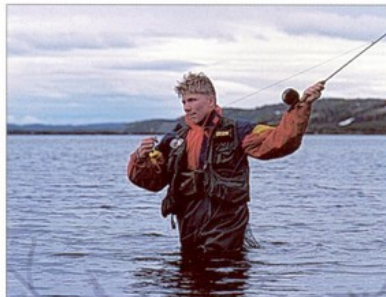
– andre på dypt vann...