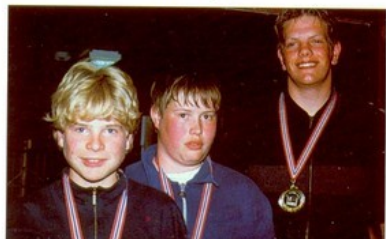
Nr. 1, 2 og 3 i NM for juniorer