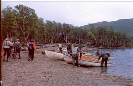
Noen av deltakerene skulle fiske fra båt