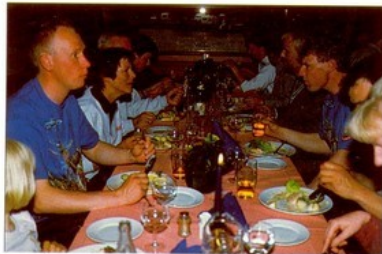
God stemning, god mat under banketten.