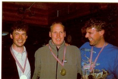
Nr. 3 i lag-NM, Stjernelaget.

Treffe gamle og nye venner, høre på egne og andres historier og særlig de som forteller om sin egen nykomponerte, fortreffelige flue som han/hun nesten fikk