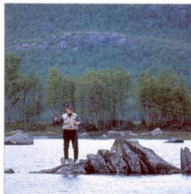
og enkelte fra steingrunn...

Lørdag ble en dag med det man kan kalle "mye vær". Det var regn, sol, overskyet, disig, kaldt, varmt, ufyselig og deilig hele dagen. Men fisket ble det, og fisk ble det tatt!