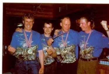
Storeslem i NM. Nr.1 og Norgesmestere: Aurivilli fra Hemsedal.